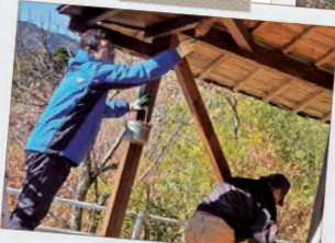
神社の改修に精魂込めて