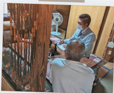
お困りごとに寄り添いながら 声を聞く活動