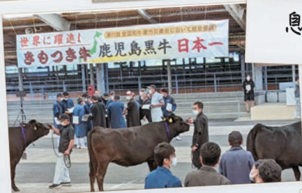
日本一連覇に向けて！