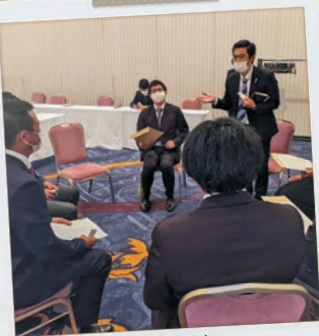
大学生と熱い 意見交換