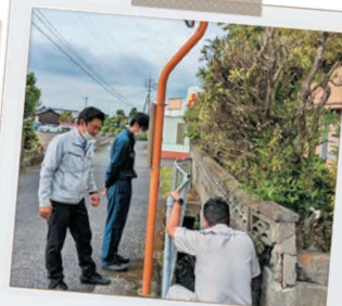
通学路安全対策調査