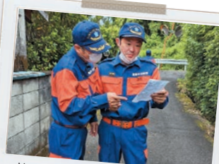
皆さまの生命と財産を守ります