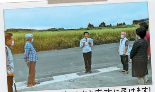
皆さまの想いをしっかりと市政に届けます！