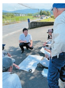
農家の意見を反映した県道整備検討中