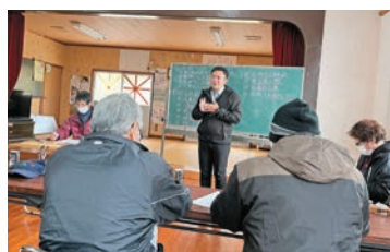
地域とともに課題の整理活動