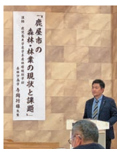
林業活性化対策に向けて