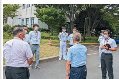
防衛省にて国家安全保障の研修