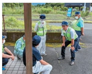
地域安全の打合せ青パト隊