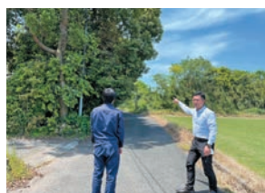
市道枝木伐採打合せ