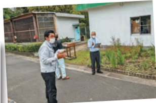
市小動物園の環境整備打合せ