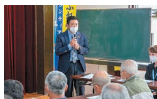
有償ボランティア立上発足式