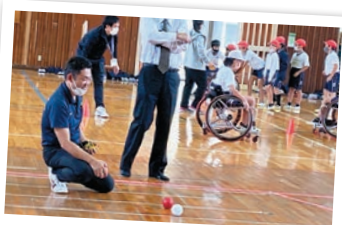
スポーツ推進委員ボランティア活動