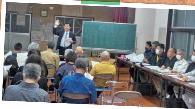
市政報告会等の様子