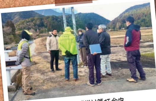
河川流域の減災対策打合せ