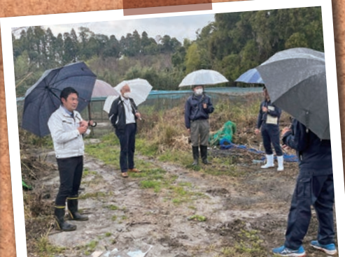
農畜産物振興に向けた生産基盤強化対策協議