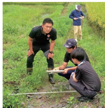
農地基盤整備に伴う現地検討会