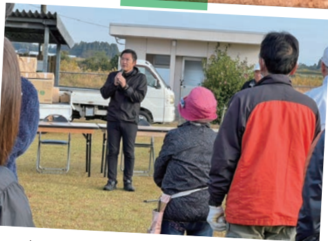
どこへでも駆けつけて市政報告いたします。