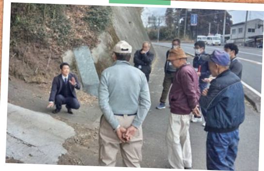
道路整備による安全確保協議