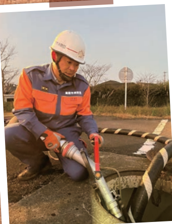
地域防災に向け消防団活動中